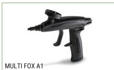
MULTI FOX A1